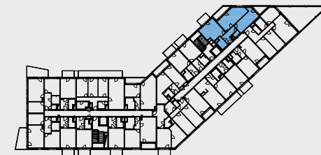
Pohled, objekt B