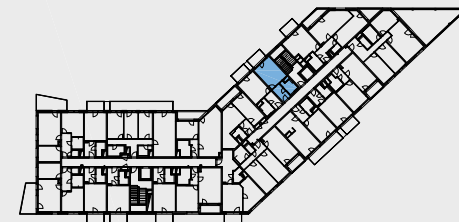
Pohled, objekt B